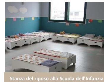
Stanza del riposo alla Scuola dell'Infanzia