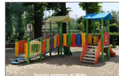
Spazio esterno al Nido