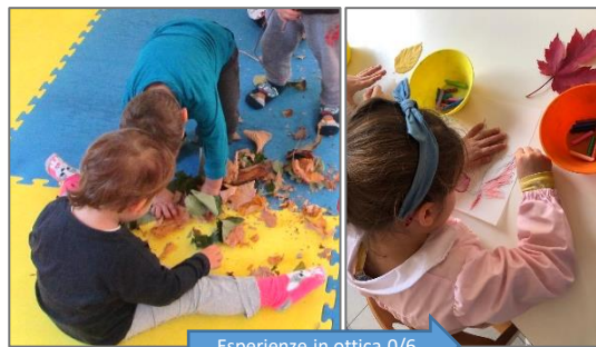
Esperienze in ottica 0/6

Esperienze e attività sono sviluppate in continuità 0-6 per accompagnare i bambini e le bambine verso traguardi di sviluppo condivisi da educatori e docenti. Nelle proposte educative sono rispettati i bisogni educativi, gli interessi e le competenze dei bambini nelle diverse età.