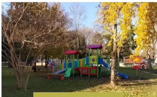
Giardino Scuola dell'infanzia

Egli è accompagnato a sviluppare tutte le dimensioni della sua personalità all'interno di un contesto di relazioni significative con altri bambini e adulti.