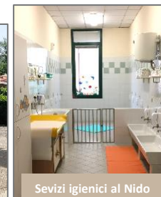
Sevizi igienici al Nido

Gli ambienti luminosi, costantemente igienizzati, sono a misura di bambino e sono organizzati in modo da favorire il gioco, le relazioni e lo sviluppo cognitivo. Curiamo gli spazi e gli arredi in modo tale da garantire la sicurezza dei bambini, sia all'interno che all'esterno.