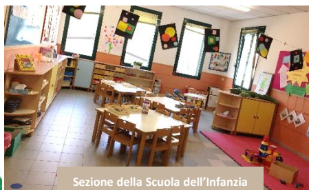
Sezione della Scuola dell'Infanzia

Il Nido e la Sezione Primavera dispongono di: